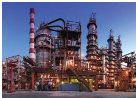
Промышленные объекты Заводы, комбинаты, крупные потребители и производители электроэнергии

"U5 Combitech" – система промышленных кабельных лотков для открытой прокладки кабелей на больших пролетах. Конструкция лотков разработана для построения надежных кабельных трасс на объектах с высокими кабельными нагрузками при больших расстояниях между опорами. Специальная конструкция лонжерона позволяет устанавливать лотки шириной до 1 метра и длиной до 9 метров с сохранением высокой нагрузочной способности трассы. Система также рекомендована к применению в условиях, где проблематично использовать обычные лотки: в зонах с высокой ветровой и снеговой нагрузками, при резких перепадах температур и обледенениях трасс.