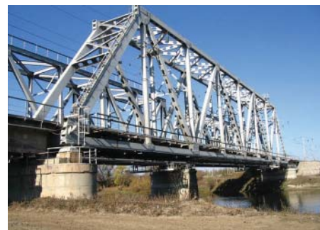
Объекты инфраструктуры Мосты, тоннели, конструкции с малым количеством опор